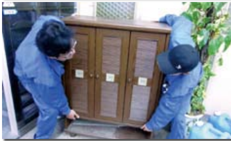
粗大ゴミの収集・処分のプロ「アルファ」が迅速・適正に処分

加古川市一般廃棄物処理許可業者「アルファ」は、電話1本で、自分の都合のよいときに専門スタッフが自宅まで来訪。重たい家具や大量のゴミの運び出しはスタッフが対応してくれるので、女性や高齢者から好評です。事務所の引っ越しや遺品整理にも対応。相談・見積もりは無料です。