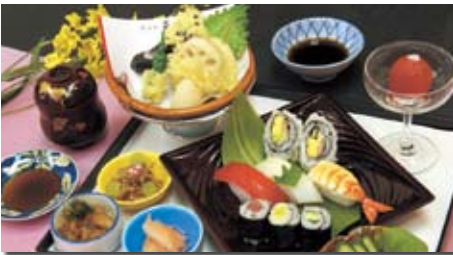
寿司・天ぷらが楽しめる人気メニュー「花まる」(1,260円)