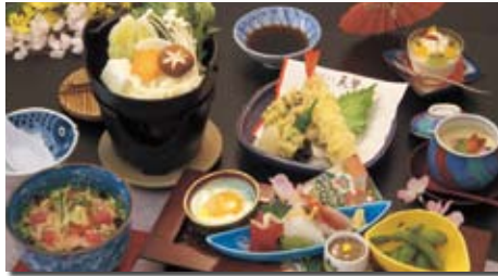
見た目も豪華でボリュームたっぷりの「冬景色」(2,500円)